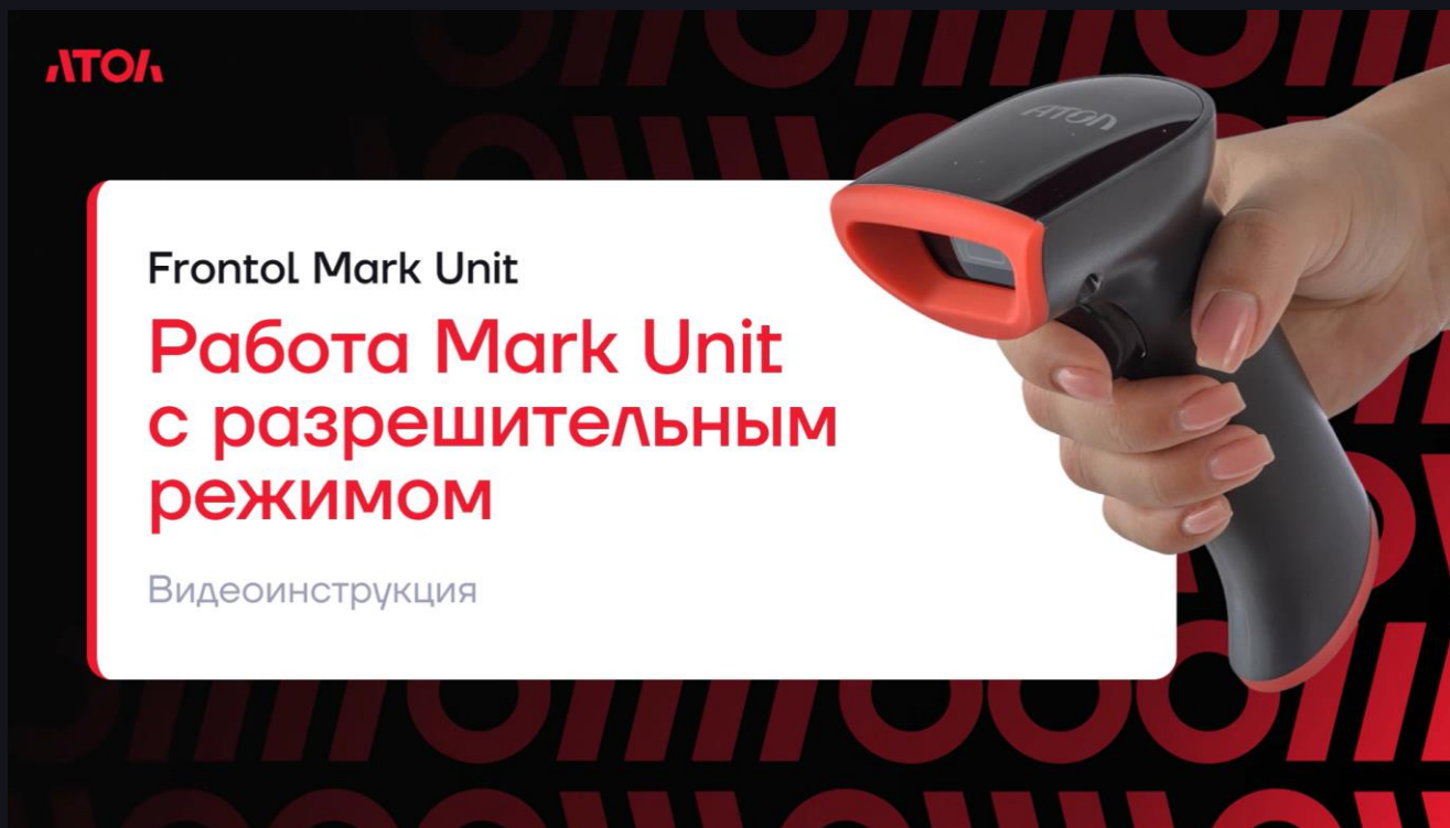
Для перехода по ссылке кликните на изображение