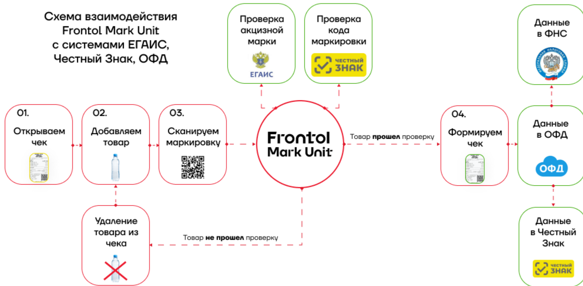
Схема взаимодействия Frontol Mark Unit с системами ЕГАИС, Честный Знак, ОФД