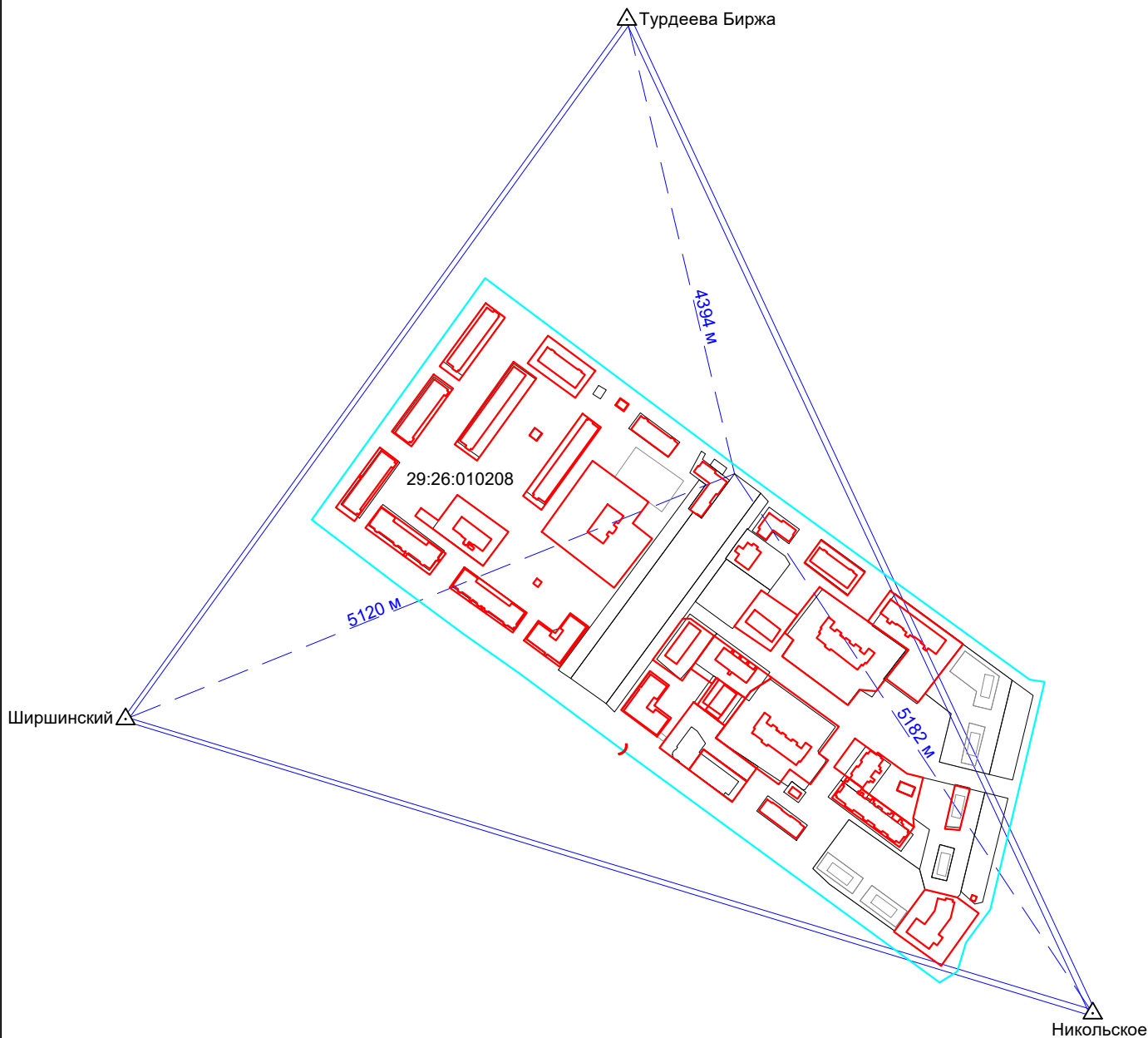
Схема геодезических построений