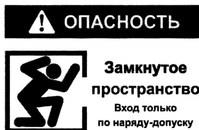
Рекомендуемый знак "ОЗП"

2. Объекты, вошедшие в Перечень 1 и не являющиеся территориально обособленными объектами, должны быть обозначены знаком "ОЗП" (рекомендуемый текст).