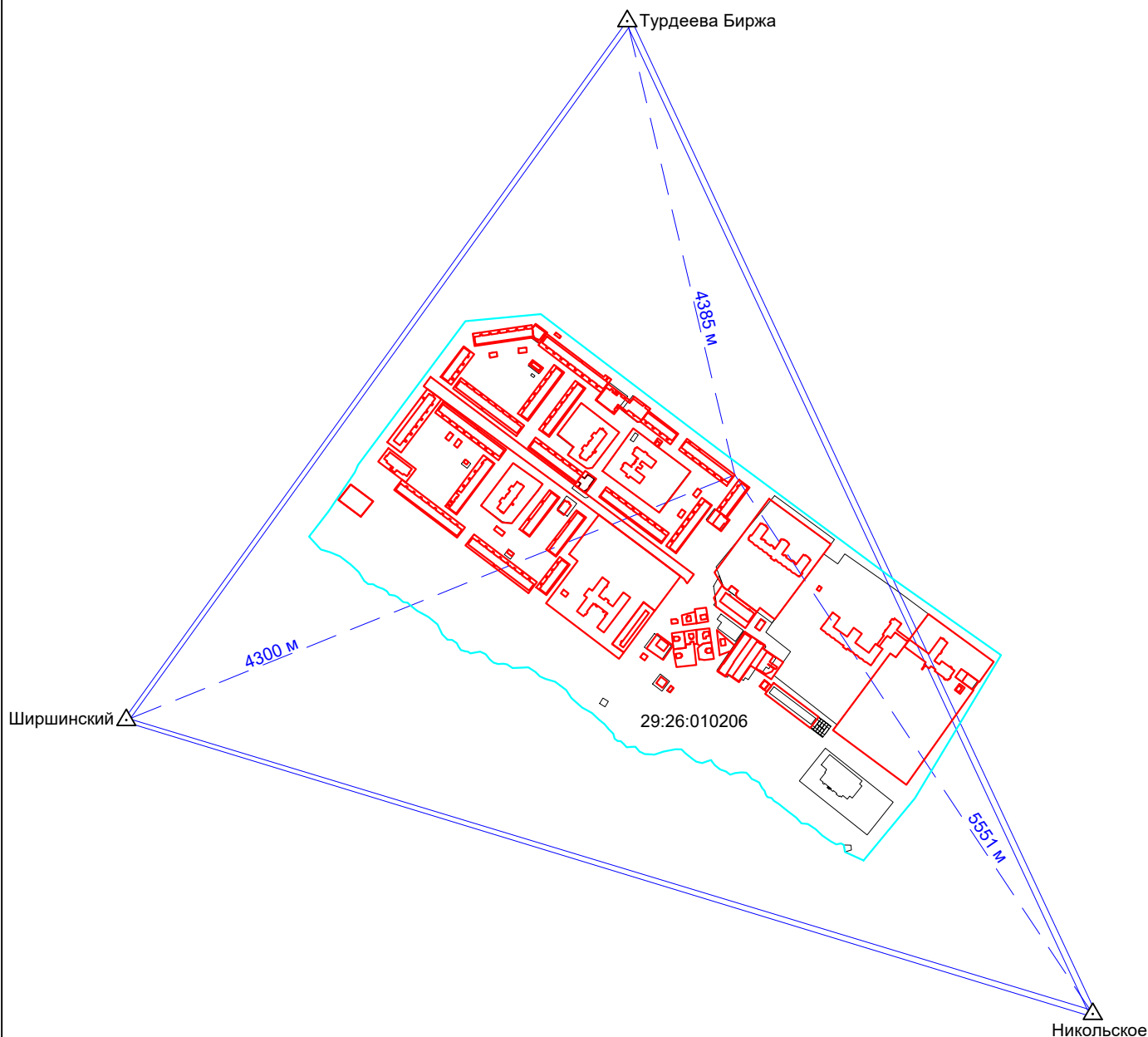
Схема геодезических построений