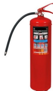
Рис. 5 – порошковый огнетушитель