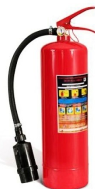
Рис. 6 – воздушно-пенный огнетушитель