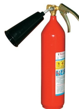
Рис. 4 – углекислотный огнетушитель

Углекислотный огнетушитель является наиболее оптимальным вариантом для жилых помещений, в первую очередь это связано с большим количеством пожарной нагрузки в помещениях, также углекислотный огнетушитель является наиболее эффективным для тушения возгорания бытовой техники или проводки. Одно из явных преимуществ углекислотных огнетушителей – его безопасность для здоровья человека.