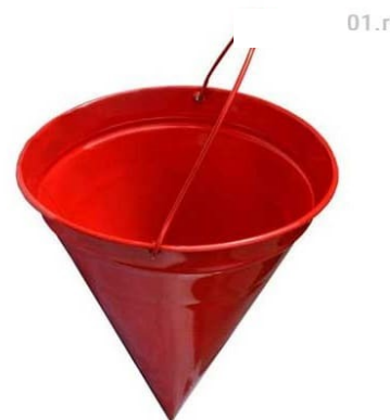
Рис. 1 – пожарное ведро

Вода - самое распространенное средство для тушения огня. Огнетушащий эффект воды заключается в охлаждении горящих материалов и очага пожара. Вода электропроводна, поэтому ее нельзя использовать для тушения сетей и установок, находящихся под напряжением. При попадании воды на электрические провода может возникнуть короткое замыкание и удар электрическим током. Также вода неэффективна при тушении горящего масла, так как она легче большинства легковоспламеняющихся и горючих жидкостей. Тушение масел и других горючих жидкостей водой приводит к увеличению площади горения.