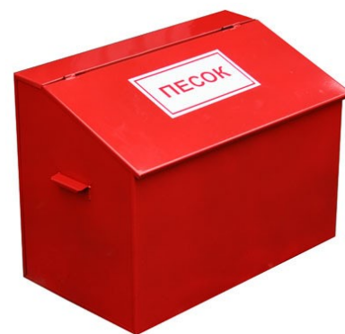
Рис. 2 – ящик с песком

Песок и земля с успехом применяются для тушения небольших очагов горения, в том числе разливов горючих жидкостей (керосина, бензина, масла, смолы и др.) Насыпать песок следует по внешней кромке горящей зоны, стараясь окружать песком место горения, препятствуя дальнейшему растеканию жидкости. Затем при помощи лопаты нужно покрыть горящую поверхность слоем песка, который впитает жидкость.