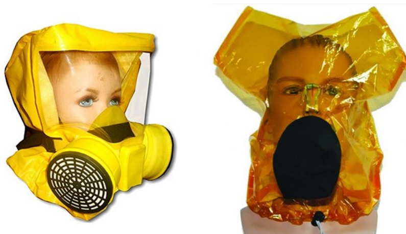
Рис. 7 – фильтрующие средства защиты органов дыхания

В зависимости от действия и назначения средства для защиты органов дыхания разделяют на две группы: изолирующего и фильтрующего типа. Для индивидуального использования гражданами подходят фильтрующие самоспасатели, так как они полностью готовы к действию и не имеют дополнительных элементов. Время защитного действия такого типа самоспасателя не менее 20 минут, чего достаточно для эвакуации человека в безопасную зону. Важно помнить, что фильтрующие средства защиты предназначены для однократного использования, их повторное применение не допускается. Наиболее распространенными марками среди фильтрующих средств защиты органов дыхания являются «Феникс» и «Шанс». После приобретения средств защиты органов дыхания для индивидуального использования, необходимо подробно ознакомиться с инструкцией по их применению.