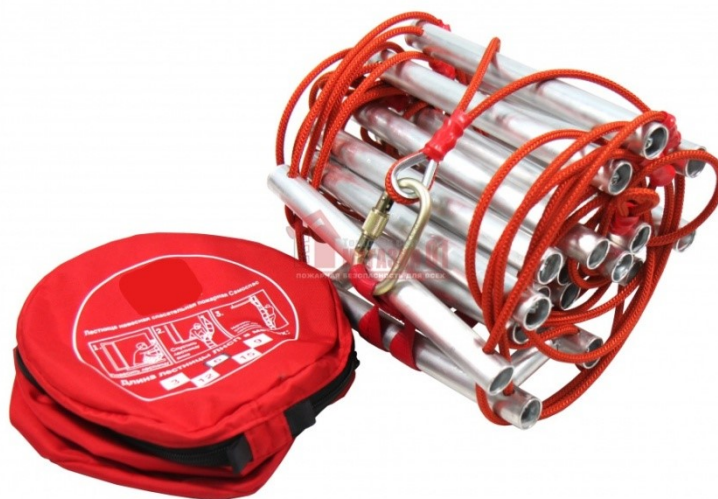
Рис. 10 – навесная спасательная лестница

Навесные спасательные лестницы предназначены для самостоятельной эвакуации людей из помещений при пожарах до прибытия пожарно-спасательных подразделений. Данный тип лестниц хранится в компактном контейнере в легкодоступном месте жилого помещения, при необходимости использования лестница фиксируется за специальные анкеры, установленные в непосредственной близости к месту предполагаемой эвакуации и вывешивается снаружи здания. Спуск по лестнице спасаемые производят самостоятельно. Основным достоинством данного типа спасательного оборудования является простота его использования. Высота спуска не более 15 метров.