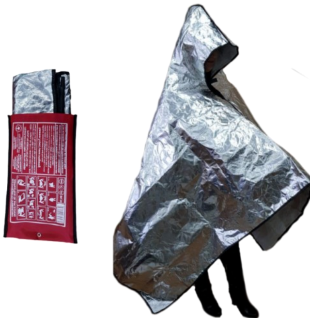
Рис. 8 – специальные огнестойкие накидки

обеспечения безопасной эвакуации при пожаре. Кроме основного назначения, огнестойкие накидки могут быть использованы как первичные средства пожаротушения (кошма) для изоляции очага возгорания. Накидка проста в эксплуатации и используется без специальной подготовки человека.