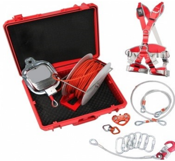
Рис. 9 – канатно-спусковое устройство