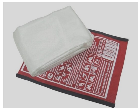
Рис. 3 - кошма

Противопожарное полотно (кошма) предназначена для изоляции очага горения от доступа воздуха. Этот метод очень эффективен, но применяется лишь при небольшом очаге горения. Нельзя использовать для тушения синтетические ткани, которые легко плавятся и разлагаются под воздействием огня, выделяя токсичные газы. Продукты разложения синтетики, как правило, сами являются горючими и способны к внезапной вспышке.